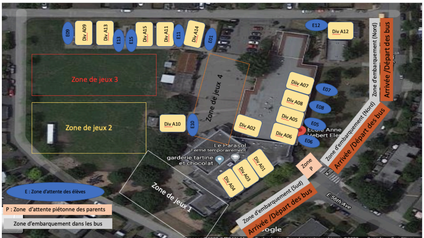
Plan d'accès et de contrôle du flux des élèves à l'école Anne-Hébert